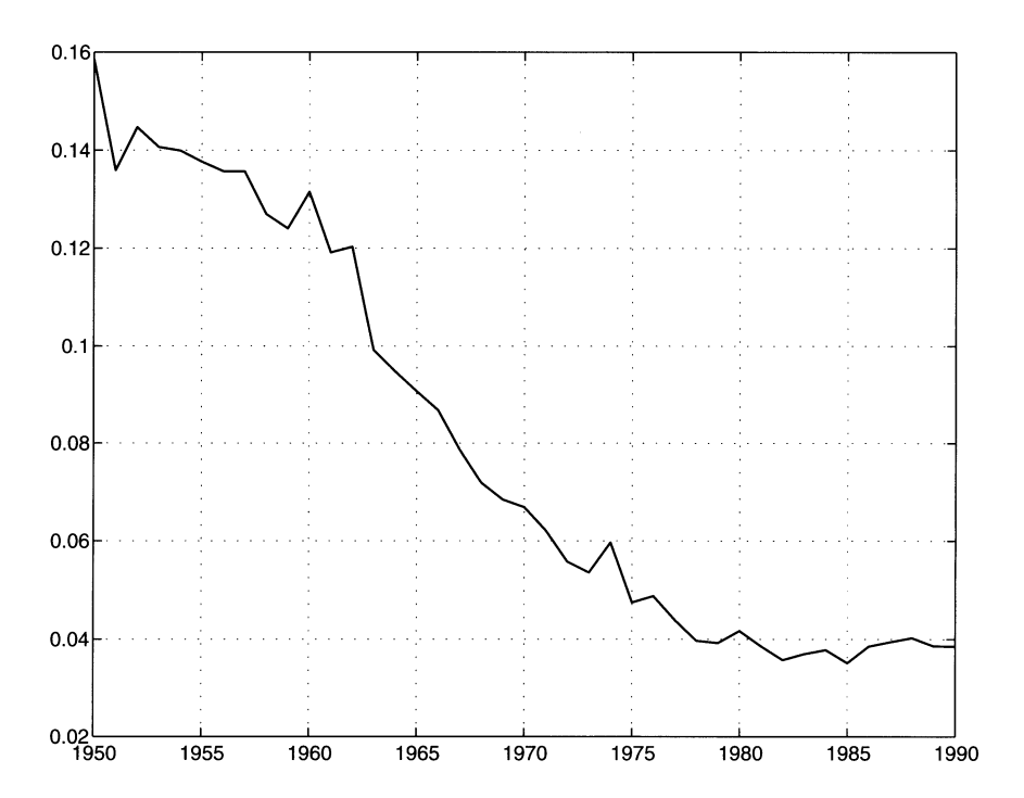
FIGURE 1 Évolution de la variance en coupe des productivités pour dix économies européennes de 1950 à 1990

Pour tester la stationnarité déterministe, c'est-à-dire l'égalité à zéro de l'estimateur de \xi , on applique un test de Wald d'égalité des scalaires dans ce vecteur. Puisque les résidus (éventuellement autocorrélés) sont tirés dans une loi inconnue, on utilise la technique du Bootstrap séquentiel<sup>6</sup>. On obtient \hat{W} = 288,108 comme statistique de Wald , et la valeur critique au seuil de 5 % est donnée par 39,973. On rejette donc la stationnarité déterministe contre la non stationnarité déterministe au seuil de 5 %.